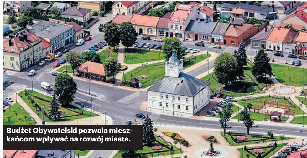
Budżet Obywatelski pozwala mieszkańcom wpływać na rozwój miasta.