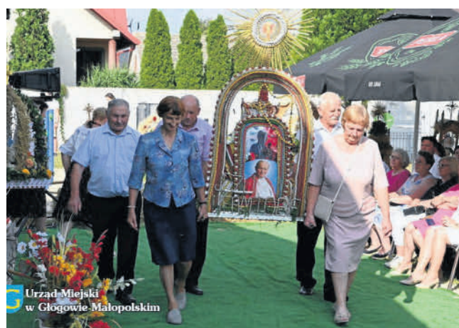
Urząd Miejski w Głogowie Małopolskim