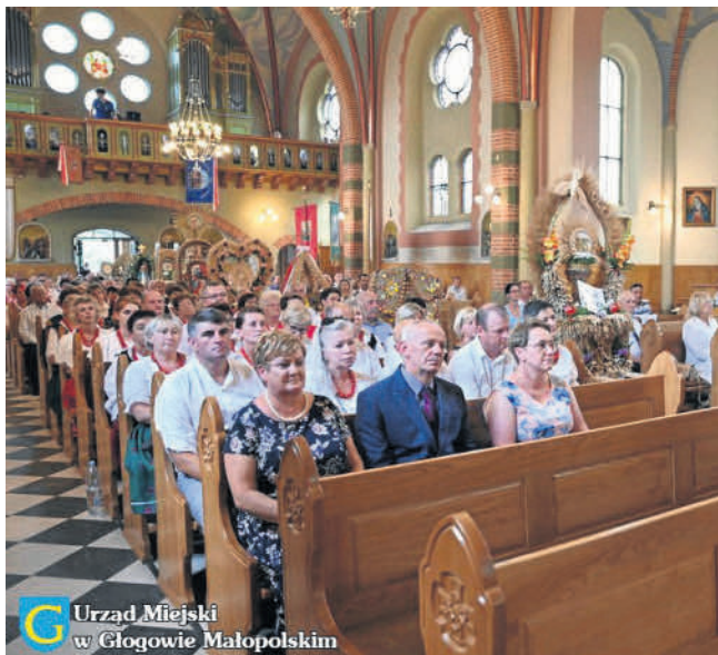
Urząd Miejski w Głogowie Małopolskim

FOT. URZĄD MIEJSKI W GŁOGOWIE MAŁOPOLSKIM (10)