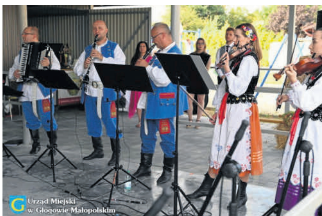
Urząd Miejski w Głogowie Małopolskim