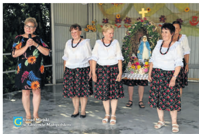
Urząd Miejski w Głogowie Małopolskim