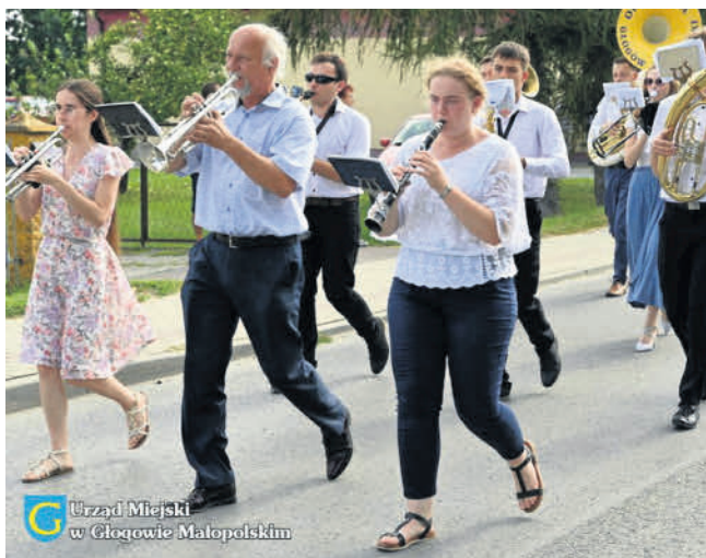
Urząd Miejski w Głogowie Małopolskim