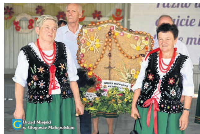
Urząd Miejski w Głogowie Małopolskim