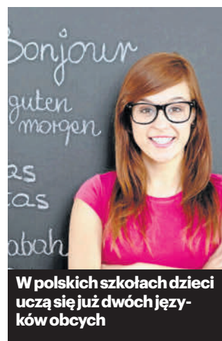
W polskich szkołach dzieci uczą się już dwóch języków obcych

Nauka języków obcych w kosmopolitycznym świecie jest czymś naturalnym, co potwierdzają dane Eurostatu. 96 proc. uczniów szkół podstawowych