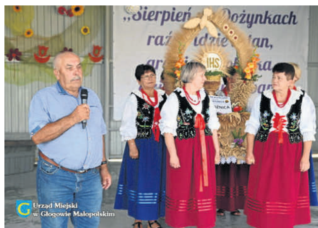
Urząd Miejski w Głogowie Małopolskim