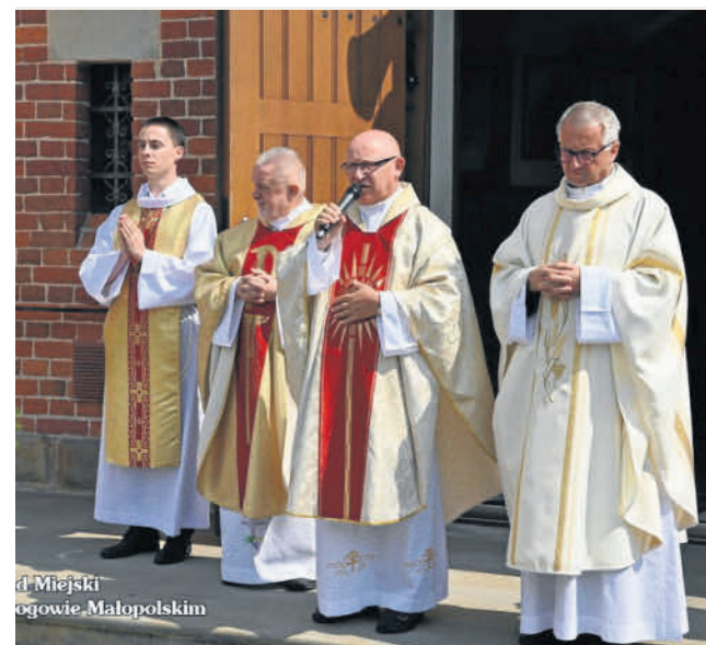
Urząd Miejski w Głogowie Małopolskim

Gośćmi specjalnymi były delegacje miast partnerskich: Spiżskie Podgrodzie ze Słowacji, Pęcryn z Ukrainy, Ibrány z Węgier, Lysá nad Labem z Czech oraz Ogrodzieniec ze Śląska, których przedstawiciele z rąk burmistrza otrzymali piękne kosze dożynkowe.