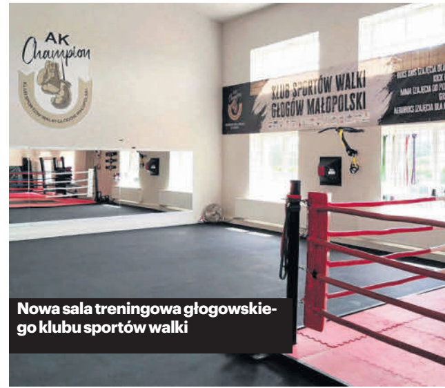
Nowa sala treningowa głogowskiego klubu sportów walki

W nowej hali odbywają się zajęcia dla dzieci, młodzieży i dorosłych. Oferta obejmuje: indywidualne i grupowe treningi boks, AeroBoks dla kobiet, boks dla dzieci, MMA, grappling, kickboxing. Ćwiczą tu osoby o różnych poziomach